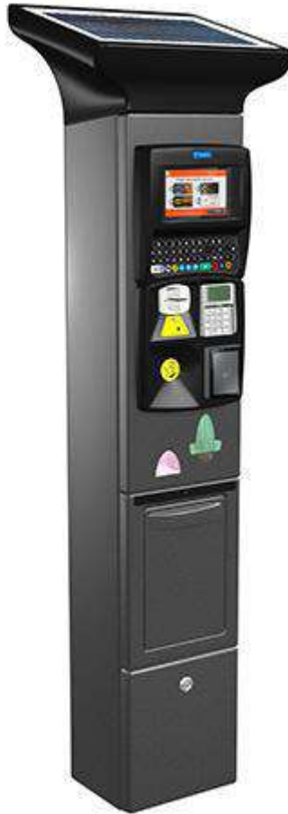
VISTA D'ASSIEME PARCOMETRO DELLA FLOWBIRD ITALIA srl